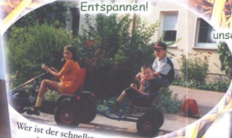
Wer ist der schnellste, unser "Riesenkettcar" der Trettraktor, oder das Bobbycar?

Ein Traum für alle Kinder, unser Hund Mike, unsere Kätzchen, Kühe, Kälber, Schweine, Hasen, Gänse und Enten alles zum Anfassen und Liebhaben!